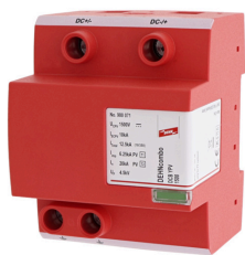
Az ábrák nem kötelező érvényűek